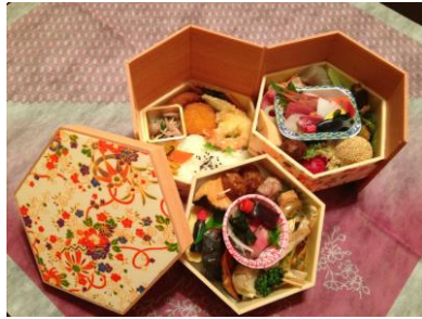
雅 3000 円