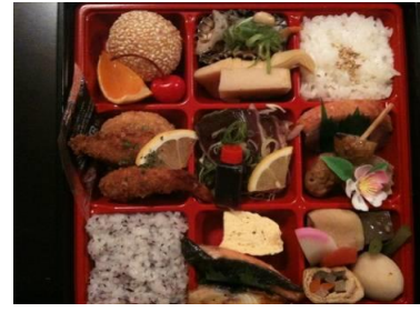
彩り 1200 円