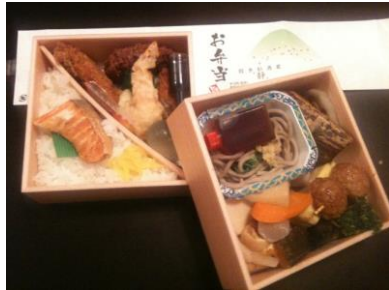
蘭「お造り無し」 1100 円