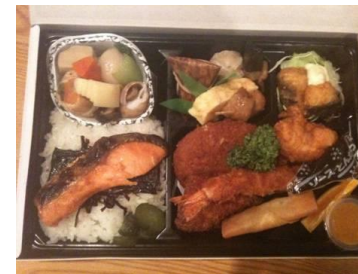
幕の内 2000 円