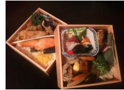
蘭「お造り入り」 1380 円