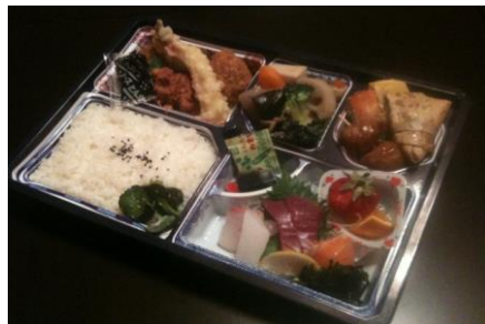
風 2500 円