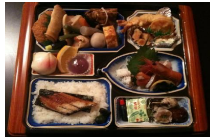
松花堂 2500 円