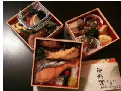
椿「お造り入り」 2300 円