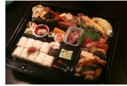
月 4000 円